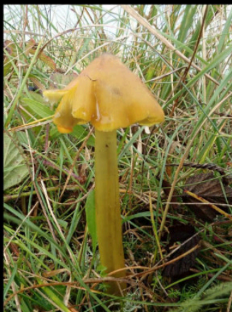
Zwartwordende wasplaat Hygrocybe conica