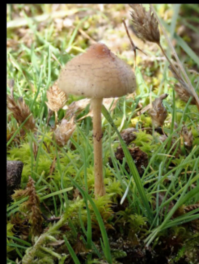
Puntig kaalkopje Psilocybe semilanceata