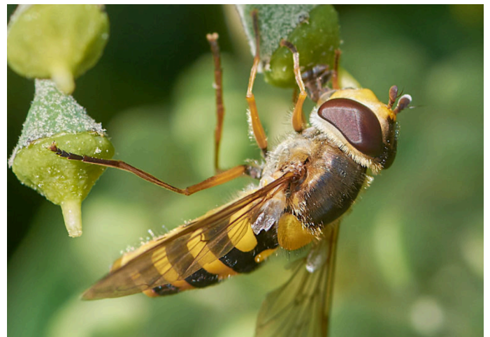
Bessenband-zweefvlieg, Syrphus ribesii

Naturalis, EIS en andere organisaties hebben 2024 uitgeroepen tot het jaar van de wesp. Dit jaar staat ook "beestje van de maand" in het teken van de wesp. In Nederland komen meer dan 5000 verschillende soorten voor, met een grote diversiteit in uiterlijk en leefwijze. Zoveel soorten bieden genoeg inspiratie voor een heel jaar wespen