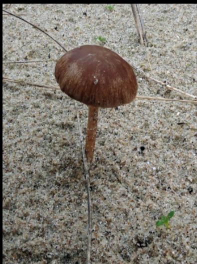
Duinfranjehoed Psathyrella ammophila