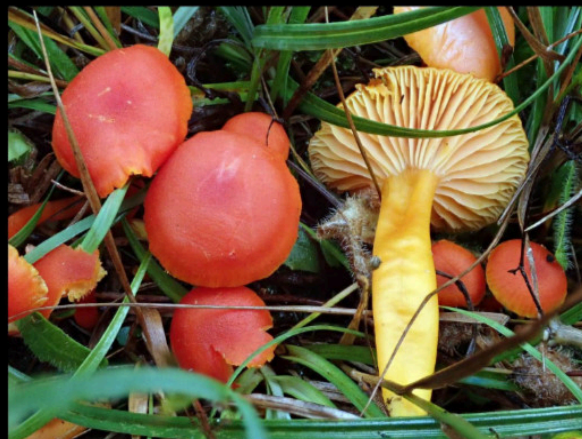
Gewoon vuurzwammetje Hygrocybe miniata