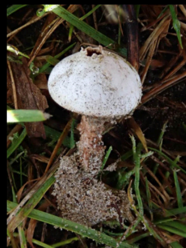
Ruwstelige stuifbal Tulostoma fimbriatum