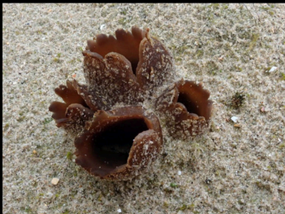
Zandtulpje Peziza ammophila