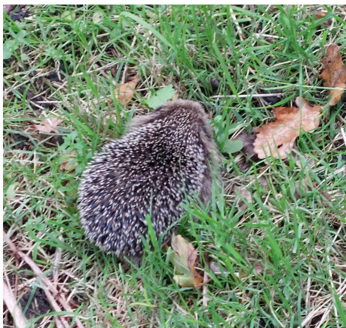
Rosie in het gras

Op een wat frissere dag in oktober zag ik net buiten ons tuinpark bij De Uithof een kleine egel, gewoon midden op de dag. Egels zijn nachtdieren, dus dat was geen goed teken. Het zat heel stil en liet zich makkelijk oppakken. In mijn fietstas nam ik het diertje mee naar huis. In een kartonnen doosje belegt met kranten en snippers, met wat kattenbrokjes gekregen van de burens, begon het al snel luidruchtig van