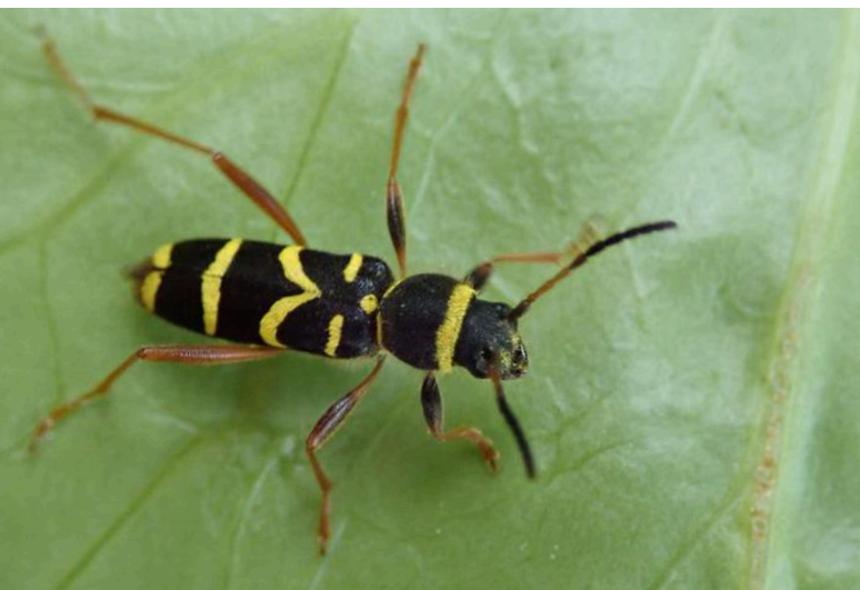
Kleine wespenboktor, Clytus arietis .

Vragen of opmerkingen: voorzitter@den-haag.knnv.nl