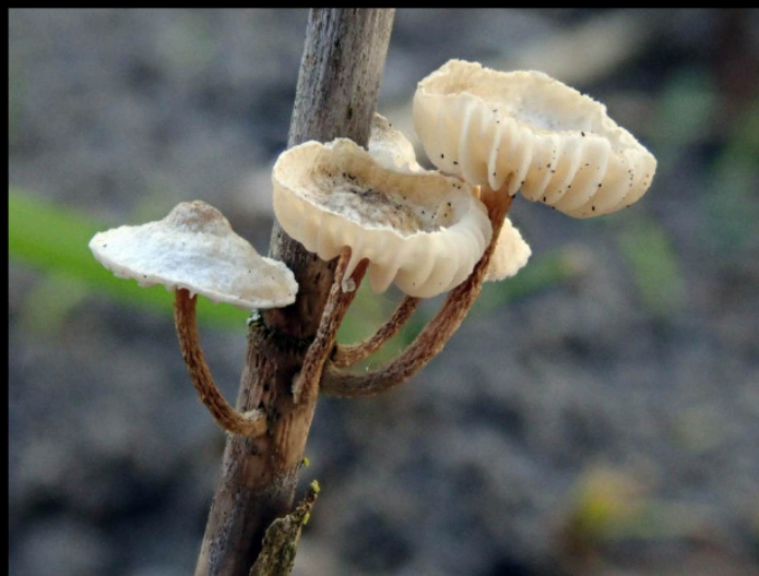
Piekhaarzwammetje Crinipellis scabella