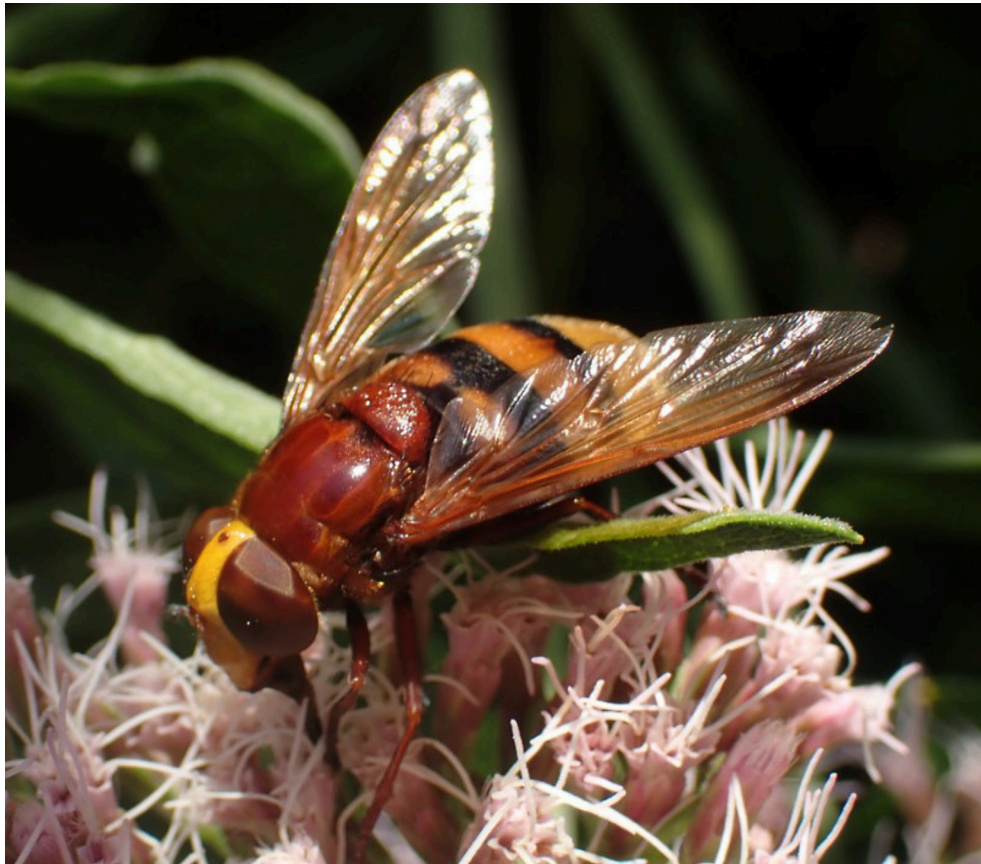
Stadsreus, Volucella zonaria .

Een heel aantal insecten maakt gebruik van de angst voor een geel/zwart lijfje, dat nabootsen heet mimicry. Een heel aantal