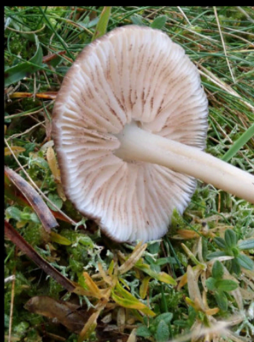
Bruine zwartsneesatijnzwam Entoloma caesiocinctum