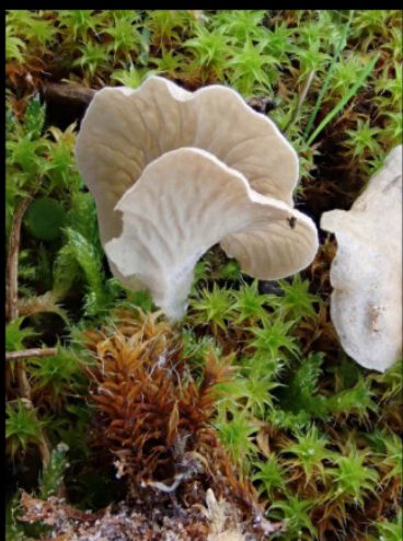
Gesteeld mosoortje Arrhenia stulata