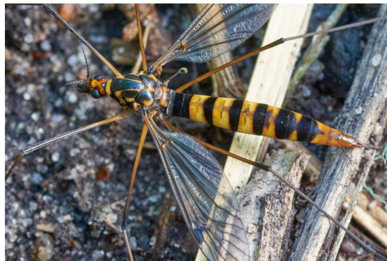
Driebandtjger, Nephrotoma crocata , betraapt tijdens het eileggen.