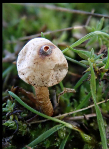
Donkerstelige stuifbal Tulostoma melanocyclum